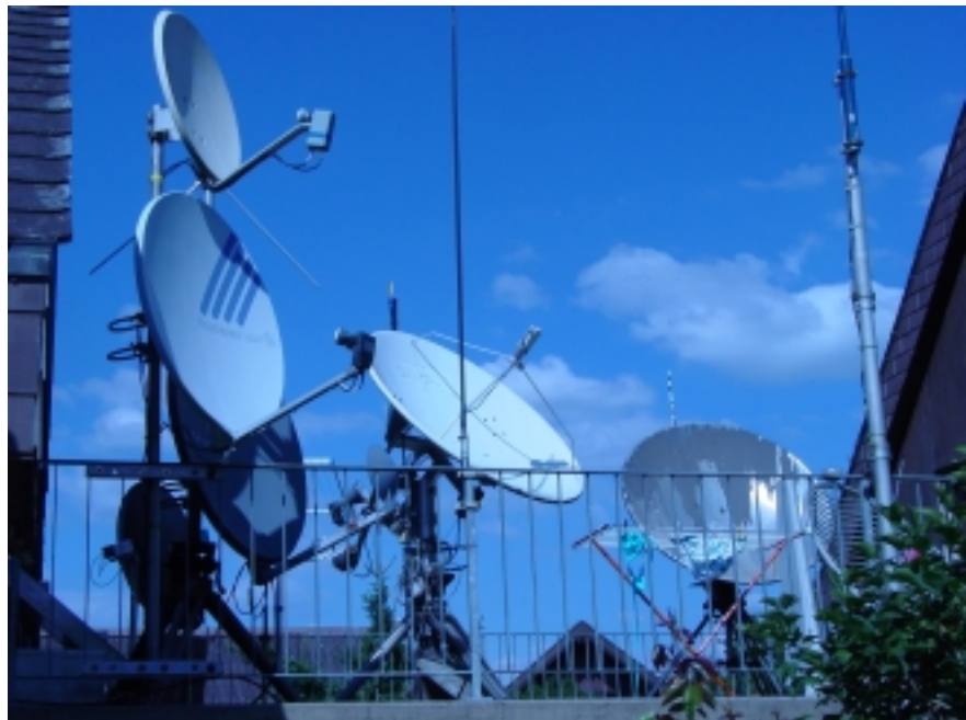
Antennenterrasse am Wohnort von HB9TJ in Belp. Ganz unten rechts: Gitter- Parabol (Poulet-Rost) ehemalige EMI-Link (4,5 GHz) im Einsatz als 1,6 GHz Meteo-Sat Empfänger.