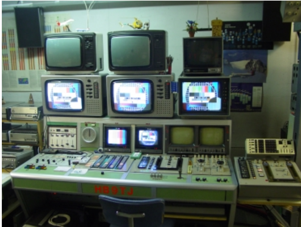
Ton Koord-Wähler Mixer1 Mixer2+Digi.Eff.Gen. Video/Audio Senderegie Arbeitsplatz