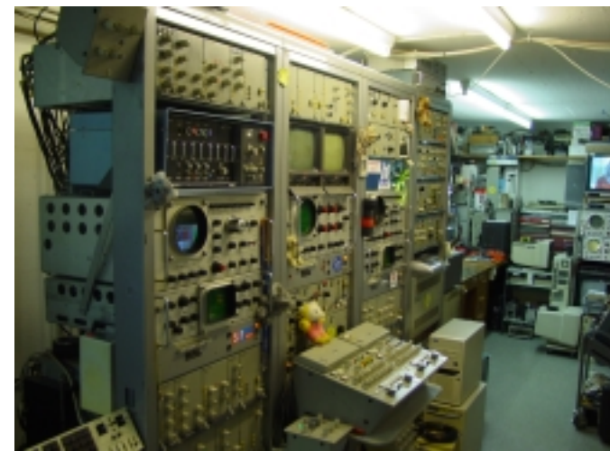
Technik zur Senderegie mit Messeinrichtung

4 Röhren Plumbikon Kamera Bau- jahr 1969 Fernseh GmbH (FESE) KC4P40 (heute Rob. Bosch-Grup- pe) seit 1976 bei HB9TJ